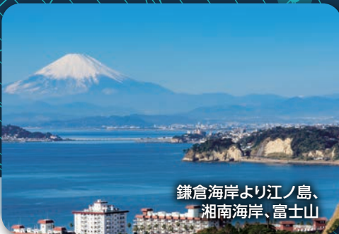
鎌倉海岸より江ノ島、 湘南海岸、富士山