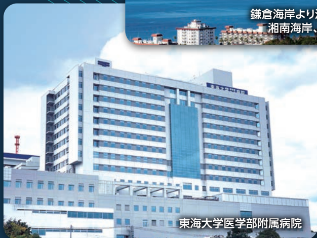
東海大学医学部附属病院