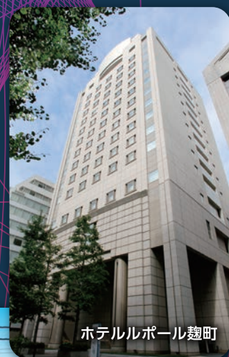
ホテルルポール麹町